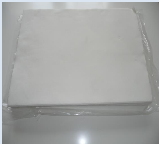
SOFT-ARKKI 40cm x 60cm(100 arkkia paketissa)