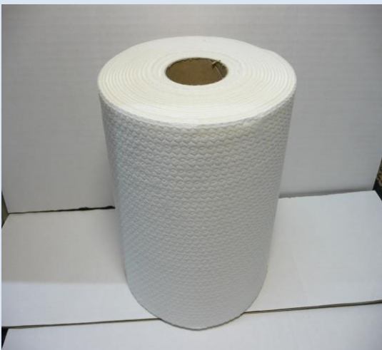
VETO-SOFT 70m x 20cm