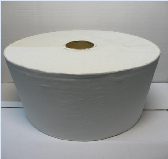
TEOLLISUUSPYYHE 1000m x 25cm