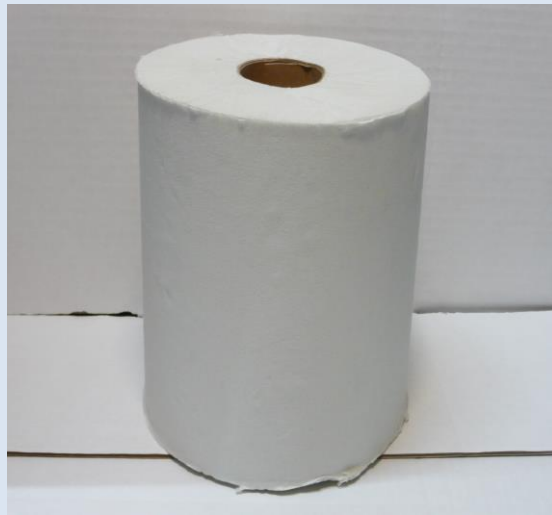
VETOPYYHE 280m x 20cm